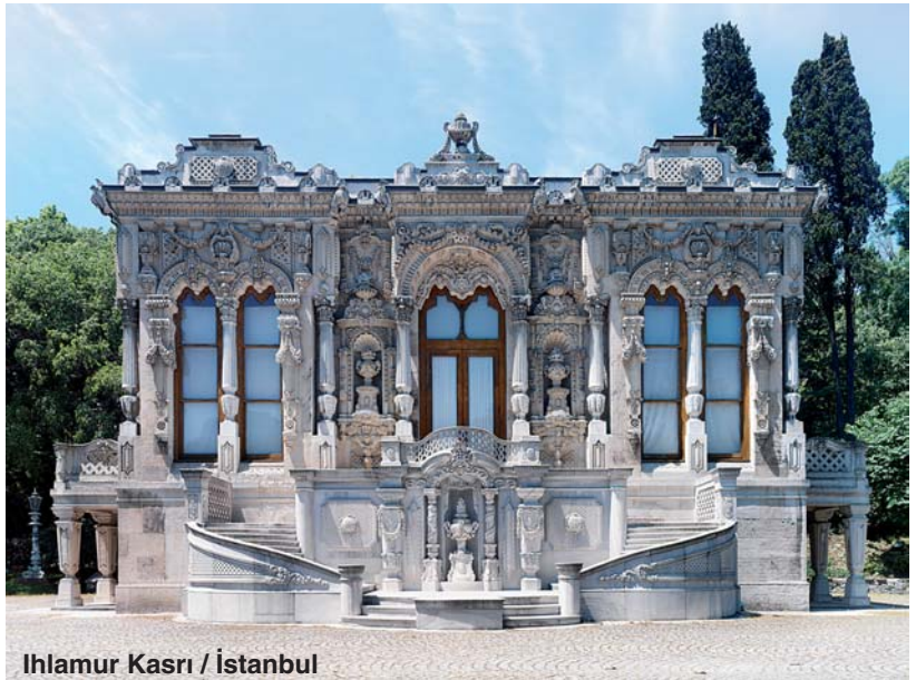
Ihlamur Kasrı / İstanbul

“Sanayi öncesi ve sanayi sonrası dönemler birbirinden çok alakasız. Bugün toplumun tanımadığı işlevlerin %90'ı o zaman yoktu. Bugün o zamanlar olmayan müthiş bir iletişim var. Karşılaştırmak pek mümkün değil. Ordan kalan hiçbir program bugün işe yaramaz. Ama şu denilebilir bugün mesela bir cami yapınca her yerde aynı 16. yy. camisi yapılıyor. Bu çok saçma. Günümüzde 70 bin tane birbirine benzeyen dünyanın en çirkin binalarını görüyoruz. Tabii şu gerçeği de gözardı etmemek gerek bugün