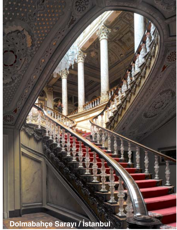
Dolmabahçe Sarayı / İstanbul

Mimarisi'nin hiçbir mimari ya da toplumdan etkilenmediği klişesi. Kendisi ile yaptığımız roportajda Kuban bu konuyla ilgili şunları söylüyor; "Bir kere şöyle Bizans'tan biz hiç etkilenmedik diyorlar. Böyle birşey kabil değil. Biz İran'dan etkilenmedik. Anadolu'dan etkilenmedik. Böyle anlamsız şey olur mu? İnsanoğlu gördüğü şeyi