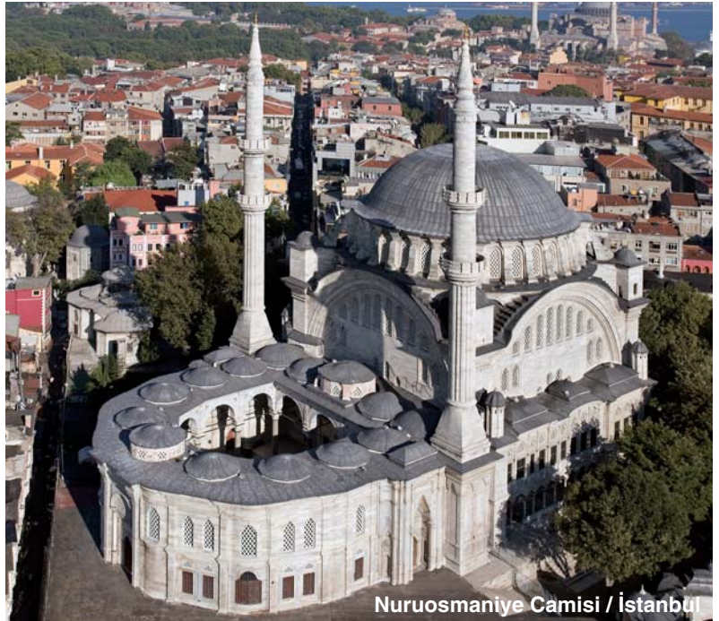
Nuruosmaniye Camisi / İstanbul

Yazarın kitaptaki başlıca amacı Osmanlı tarihi, kültürü ve sanatına dair önyargıları ortaya koymak ve 19. yüzyıldan bu yana Türk ve yabancı tarihçiler tarafından oluşturulan klişelere bir son vermek. Bir örnek vermek gerekirse kitapta camii olarak atfedilen bir çok yapının aslında zaviye olduğu gerçeği özellikle vurgulanıyor. Yazarın yıkmayı hedeflediği klişelerden biri de Osmanlı