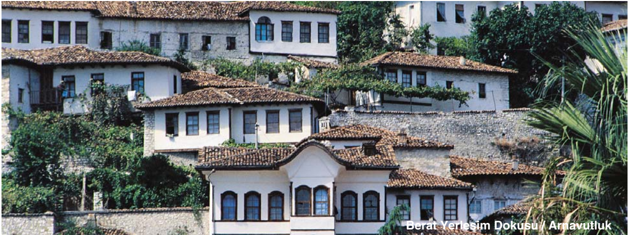
Berat Yerleşim Dokusu / Arnavutluk

Ayrıca Osmanlı Mimarisi'nin tanıtımı kapsamında, Yapı Endüstri Merkezi ve Topkapı Sarayı Müzesi'nin işbirliği ile kitabın içeriğinden seçilmiş, fotoğraf sanatçısı Cemal Emden tarafından çekilen fotoğrafların derlendiği “Osmanlı Mimarisi'nden Bir Kesit” sergisi Topkapı Sarayı'nda 25 Mayıs – 24 Haziran 2007 tarihleri arasında sergilendi.